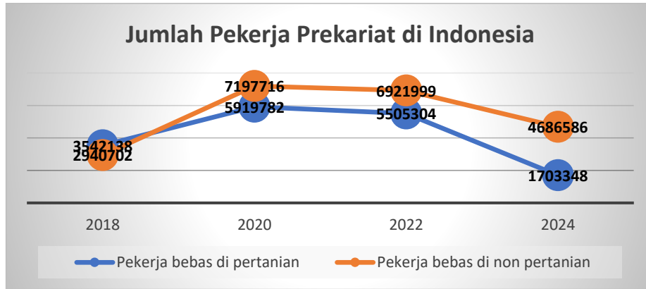
Grafik 2. Jumlah Pekerja yang terkategori Prekariat di Indonesia

peningkatan pekerja prekariat akibat perubahan ekonomi global, otomasi, dan sistem kerja fleksibel.